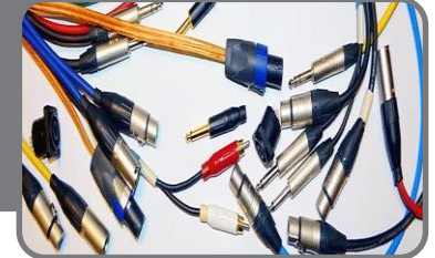
Комплект проводов для коммутации акустического оборудования (50 000 руб.)