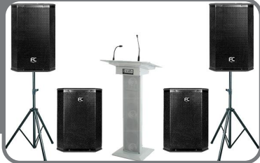
Активная Акустическая Система (135 198руб.)

средства усиления и разложения звука в акустической системе