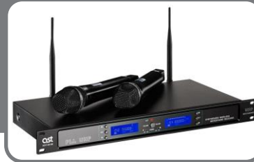
Радио Микрофоны (20 300руб.)