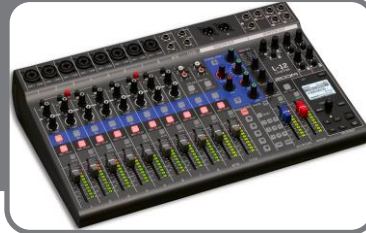
Микшерный пульт с эффектами (27 020 руб)