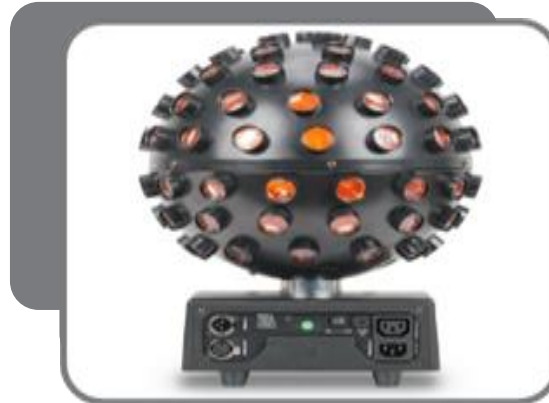
Лазерный свет (18.500 руб.)