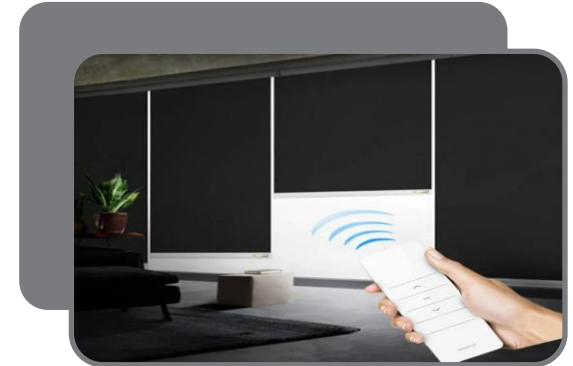
Темные рулонные Шторы с Электроприводом (150.000)