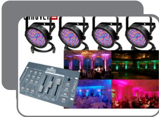
Световой комплект (54.160руб.)

средства усиления освещенности и яркости сцены, тонировка оконных проемов